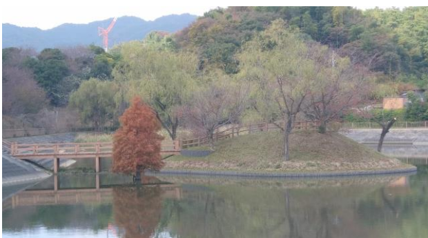
向こうに建設中の総合病院